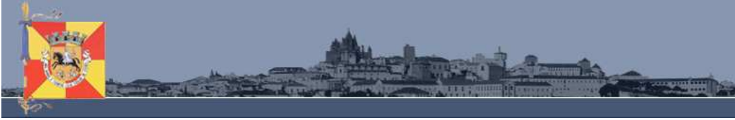
TABLE DES ANNEXES